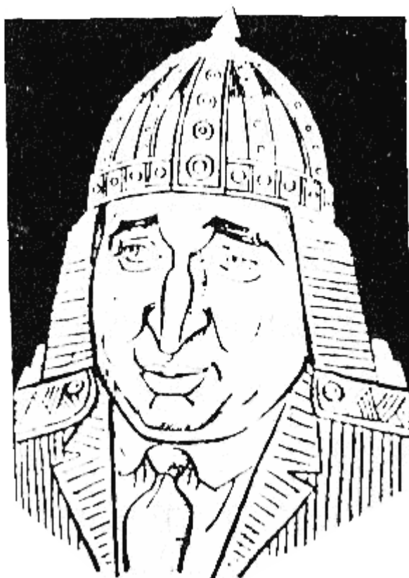
ОМОРТАГ (815 г. — 831 г.), „изчезнал измежду хората...”