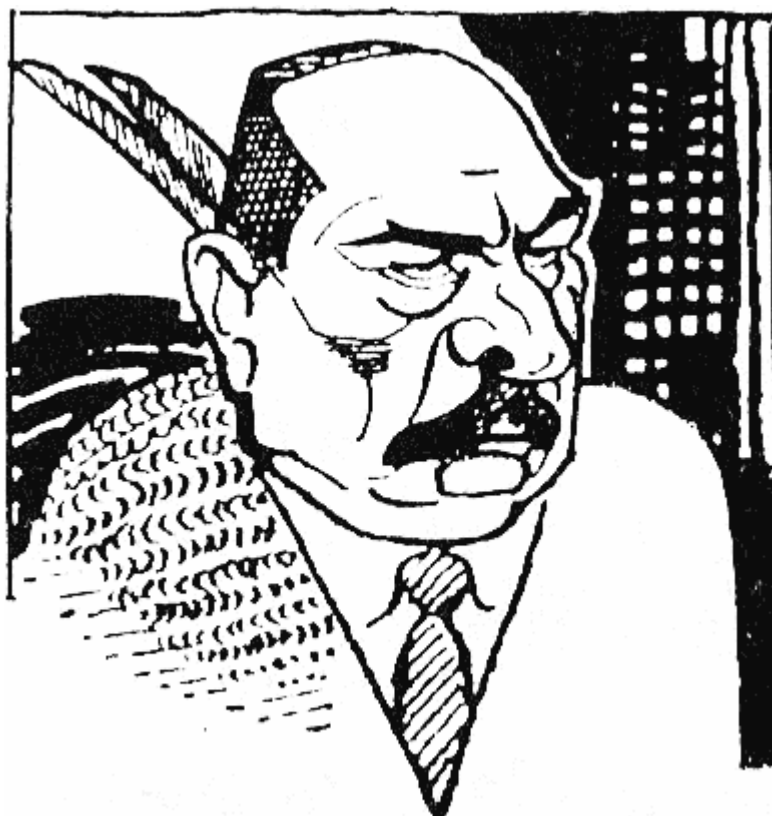
КУРТ от 08.02.584 г. до 27.04.642 г. (пак според Златарски)