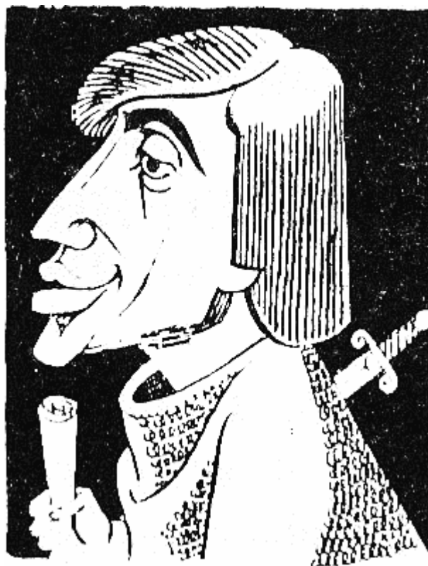
ДИЦЕНГ I (815 г. — 815 г.), убит след няколкодневно/седмично ханстване