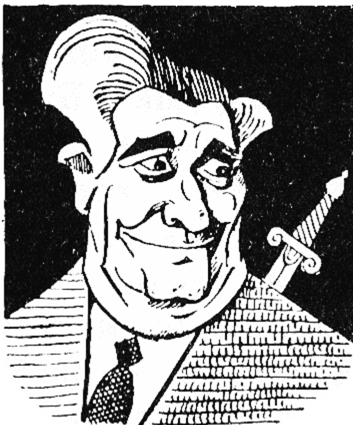
МАЛАМИР (831 г. — 836 г.), „посечен от сърпа на божие правосъдие...”