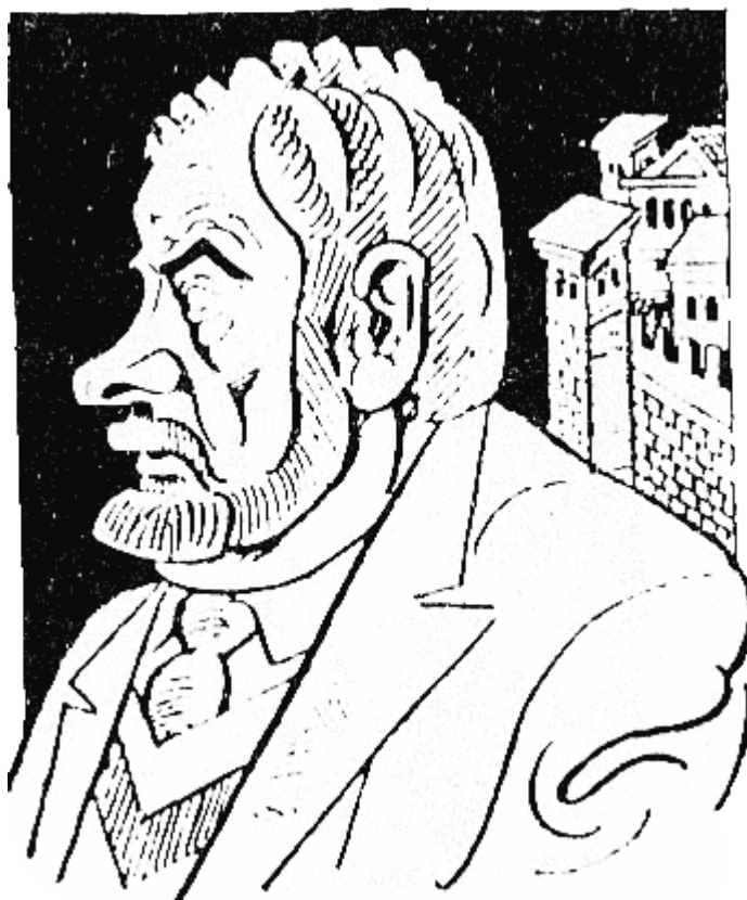
ЦОГ I (814 г. — 814 г.), заклан видимо