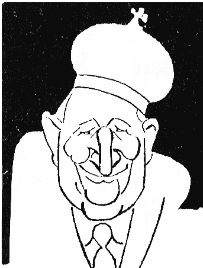
ИРНИК от 3 март 437 г. до 5 септември 582 г. (по изчисления на проф. Васил Златарски т. първи стр. 483)