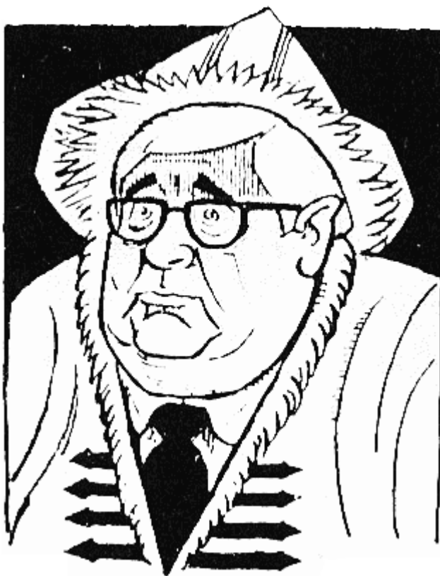
САБИН (764 г. — 766 г.) избягал във Византия, оставяйки за наследник...