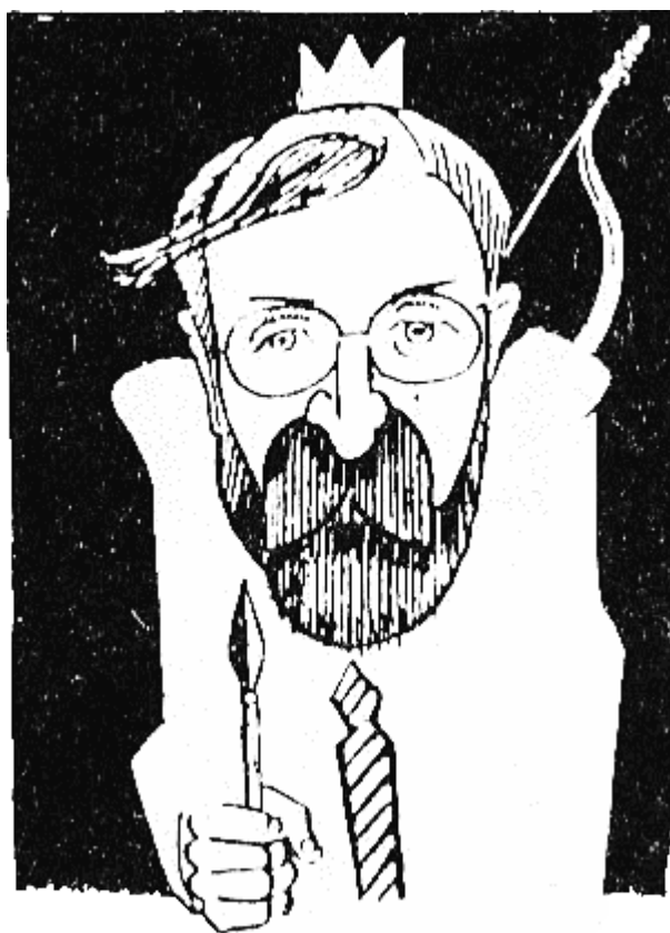
КАРДАМ (7?? г. — 7/8?? г.) предвид старостта, може би умрял естествено?