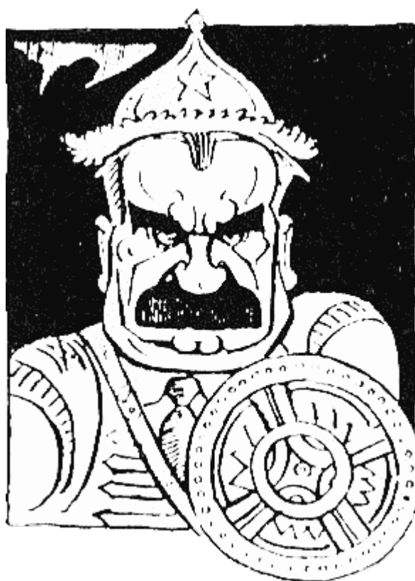
ТЕЛЕЦ (761 г. — 764 г.) убит от боилите заради злия си нрав