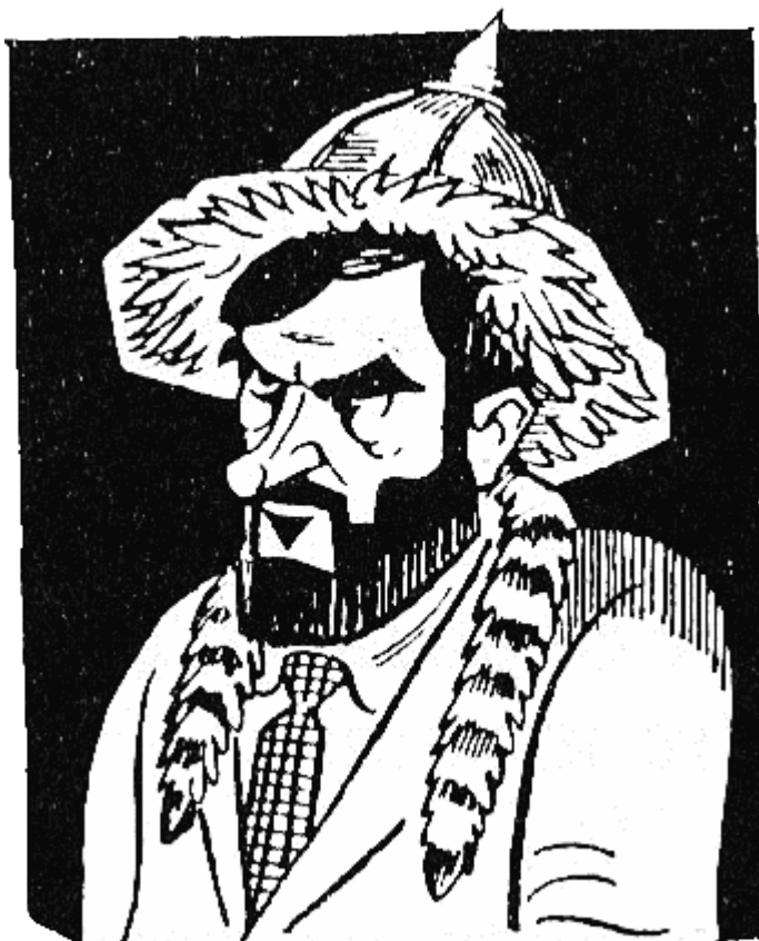
ПРЕСИЯН (836 г. — 852 г.), изчезнал безследно