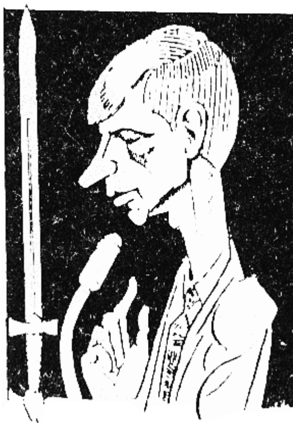
ТОКТУ I (766 г. — 777 г.) заклан при опит за бягство в Делиормана