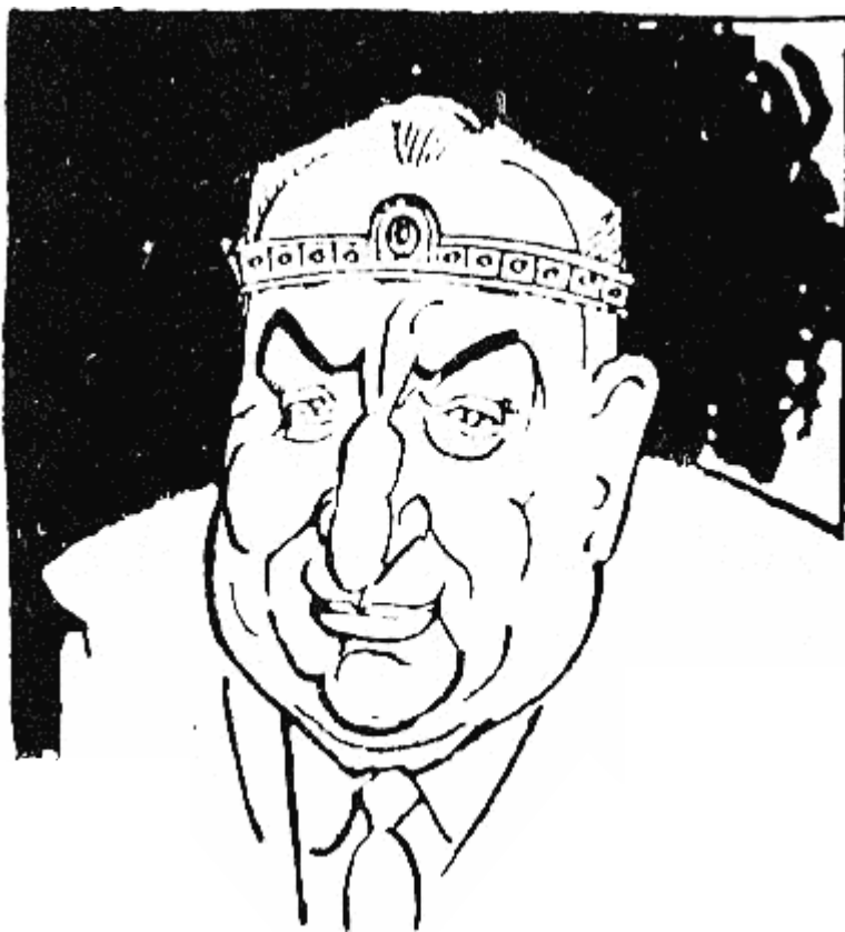
ТЕРВЕЛ (701 г. — 718 г.) исчезнал безследно