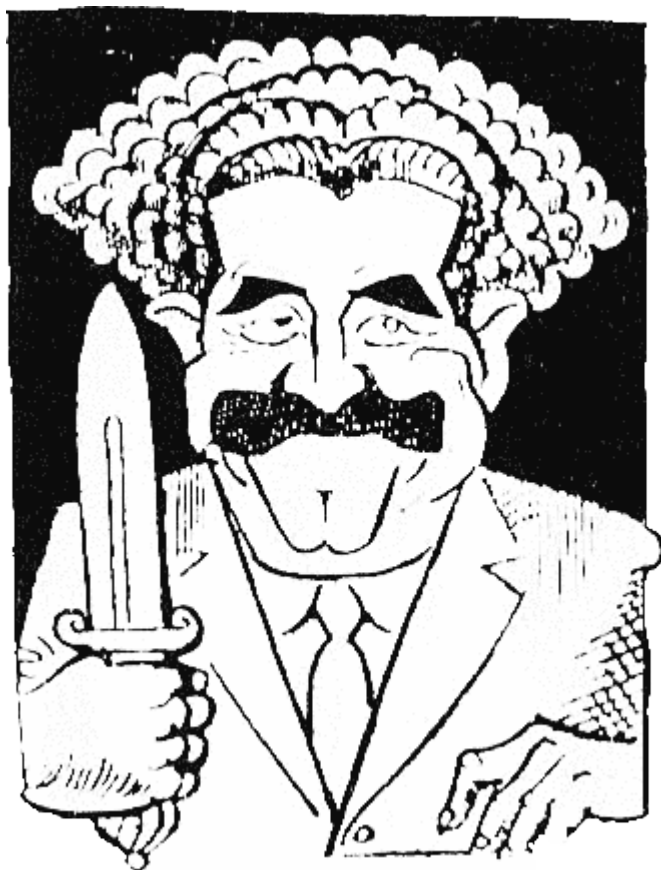
ВИНЕХ (756 г. — 761 г.) маслото му светила Угаиновата партия