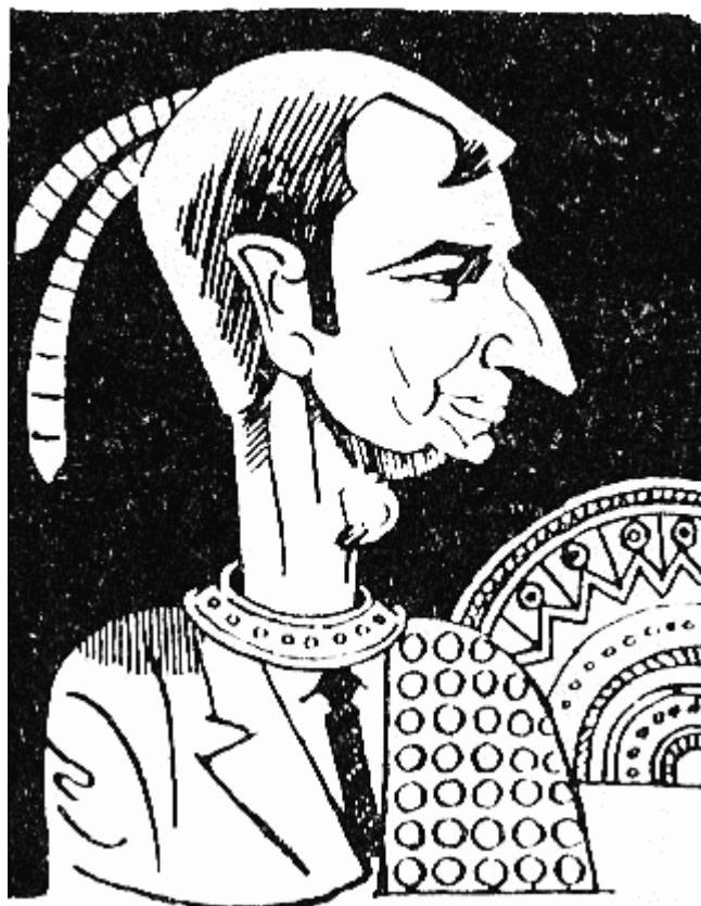
Това е счупеният череп на ПАГАН (767 г. — 768 г.), пречукан и ограбен