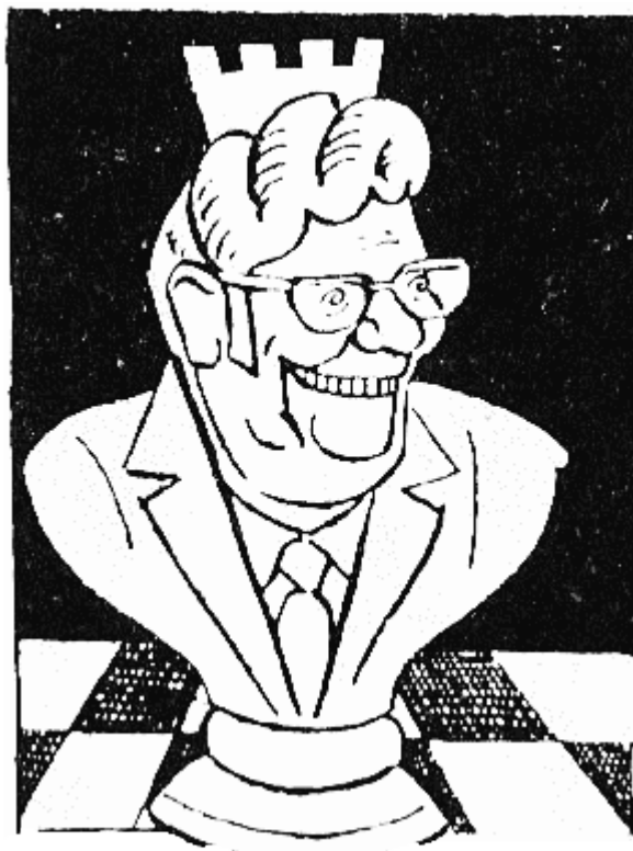
КОРМИСОШ (739 г. — 756 г.) след несполучлива война, починал скоропостижно!