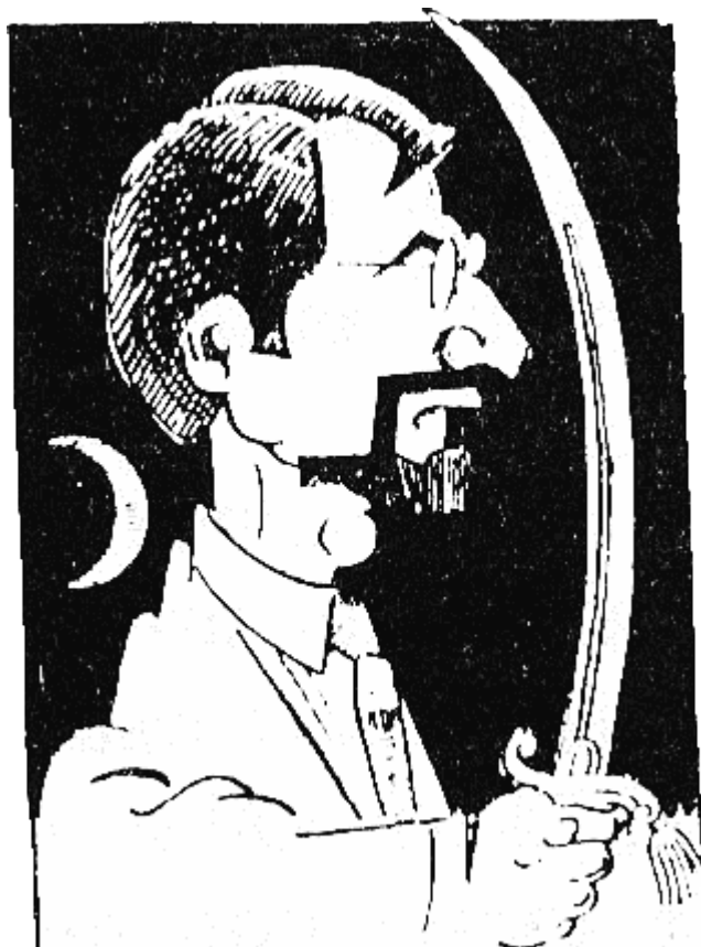
БОРИС I (852 г. — 889 г.), отишъл в манастир като КУДЕЯР от „жили 12...“