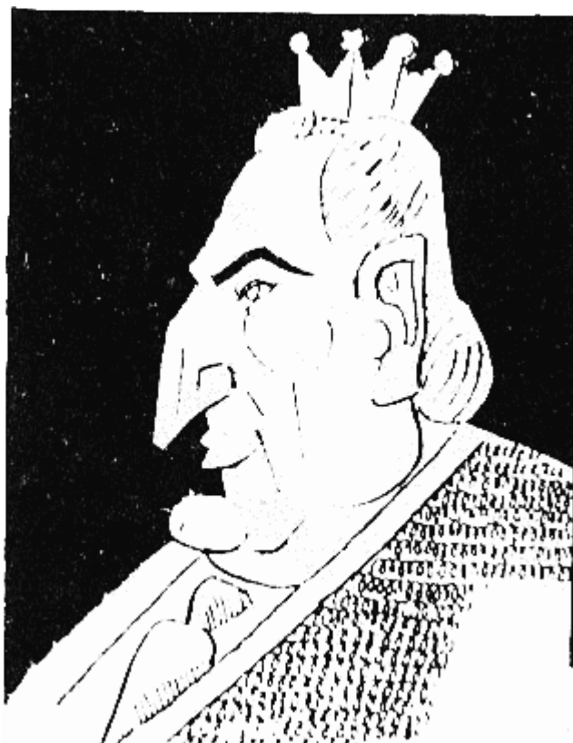
...ОМАР (40 дни в 766 г.) изчезнал съвършено безследно с Вокиловци