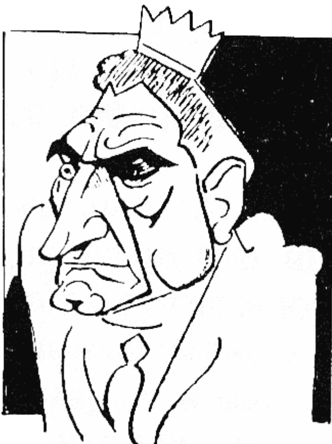
ГОСТУН от 05.09.582 г. до 08.02.584 г. (пак според Златарски)