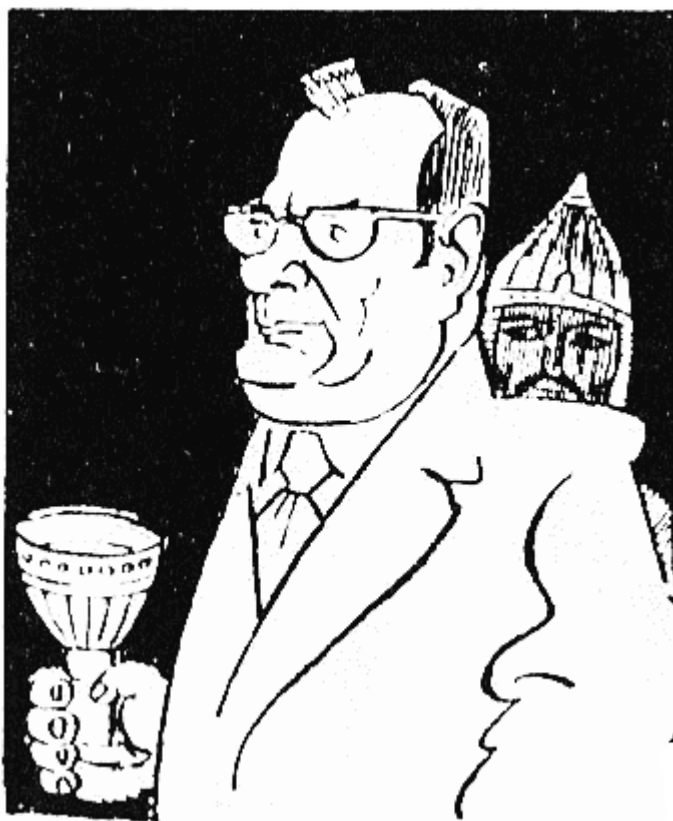
СЕВАР (724 г. — 739 г.) край на династията ДУЛО, убит или изчезнал безследно