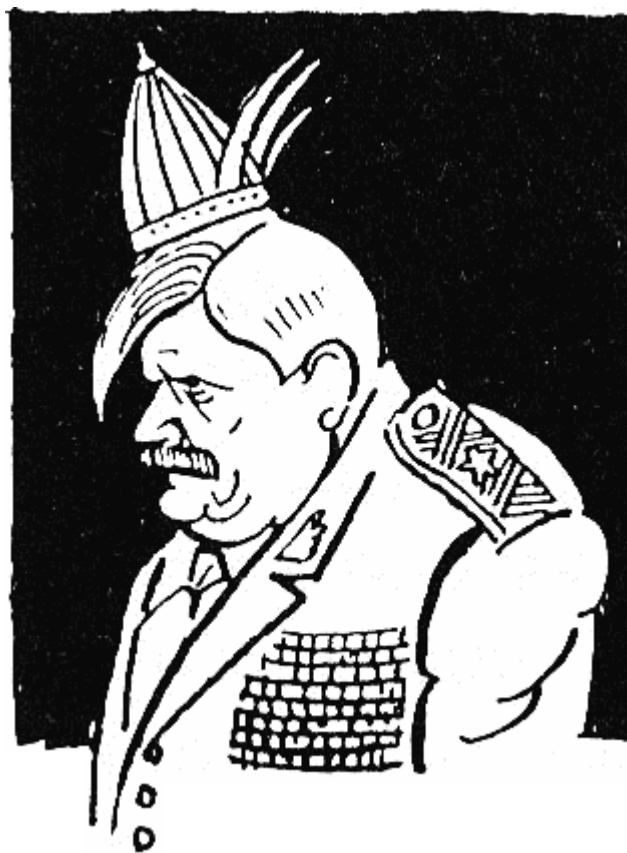
ТЕКУЧ I (718 г. — 724 г.) не оставил никаква вест