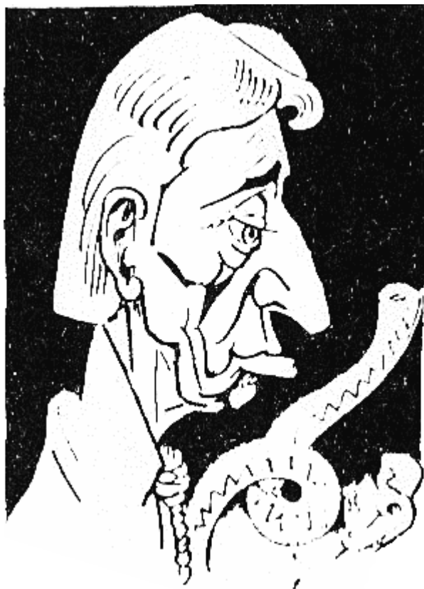
КРУМ (803 г. — 814 г.), заклан „невидимо“