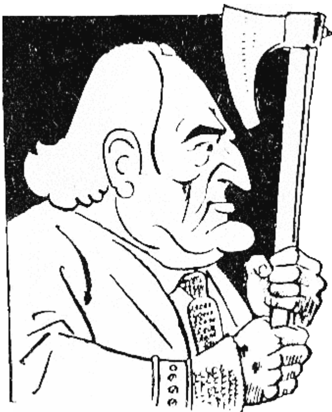
ТЕЛЕРИГ (768 г. — 777 г.) емигрирал във Византия и се оженил добре